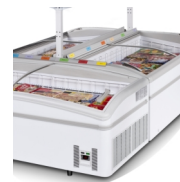
Instalacja wyspowa, opcjonalne półki