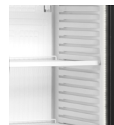
Oświetlenie LED wewnątrz obramowania drzwiczek